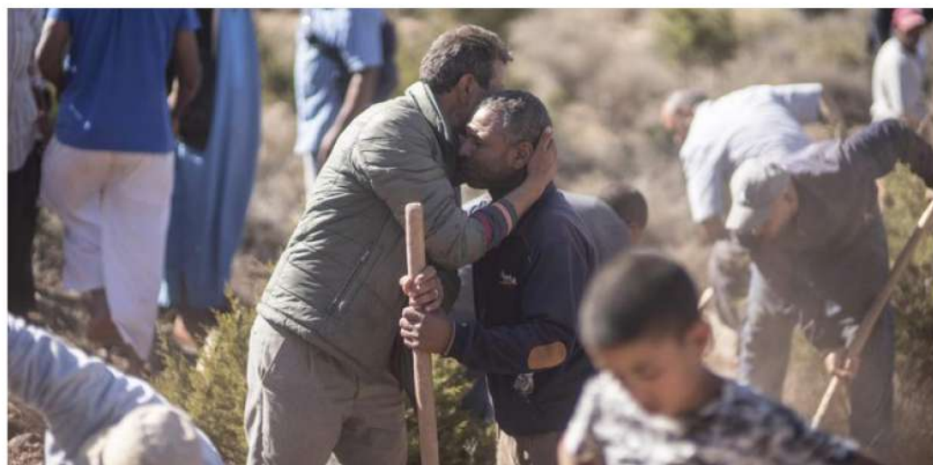
Saling menguatkan korban gempa bumi Maroko.

Musibah adalah bagian tak terhindarkan dari kehidupan manusia. Kapan pun atau di mana pun, bencana alam seperti gempa bumi bisa mengubah segalanya dalam sekejap. Salah satu nilai yang paling murni dalam kemanusiaan adalah sikap empati dan gotong royong dalam menghadapi situasi darurat seperti ini.